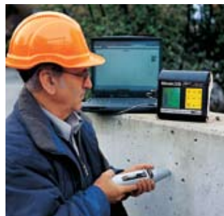
Prüfung und Datenübertragung zu PC/Laptop mit der PC-Software ProVista