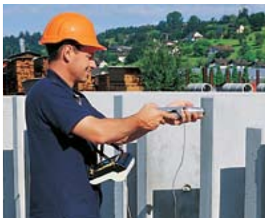
Serienprüfung an vorfabrizierten Betonelementen mit automatischer Datenspeicherung